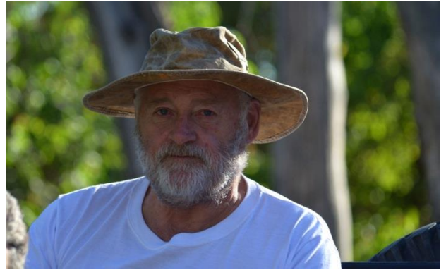
24 Botswana På eventyr i land nummer 100!

På dette eventyr, opnåede jeg også at besøge land nummer 100, en sand milepæl! Det Sydlige Afrika er enormt spændende område med nogle af verdens bedste safariparker.