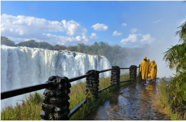
10 Zambia Livingstone Victoria Fall

På gode veje nærmer vi os grænsen til Botswana. Nogle gange når vi op på 200 km/t, mens marchhastigheden ligger som regel omkring de 150 km/t. Men vi må passe på, da geder og æsler pludselig kan krydse vejen.