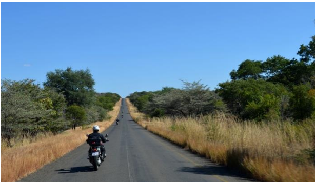
13 Zambia Kazungula Road to Botswana

På gode veje nærmer vi os grænsen til Botswana. Nogle gange når vi op på 200 km/t, mens marchhastigheden ligger som regel omkring de 150 km/t. Men vi må passe på, da geder og æsler pludselig kan krydse vejen.