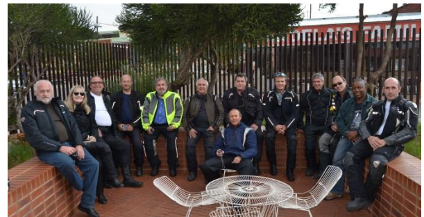
02 Syd Afrika Soweto MC Gruppen

Første stop: Soweto. Vi besøger det hus, hvor Nielson Mandela og hans anden kone Winnie boede i 1990 efter Mandelas løsladelse fra 27 års fængsel.