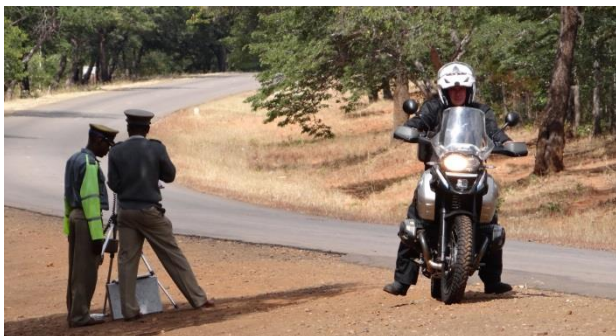
05 Zimbabwe Bulawayo road Hastighedsbøde