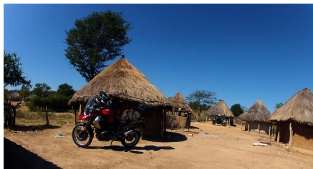
08 Zimbabwe Hwange landsdsby besøg