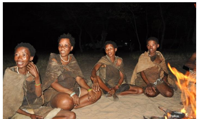
21 Botswana Kalahari San Bushmans Camp

Okovango Deltaet er et stort indlandsdelta. Almindeligvis løber floder ud i havet, men ikke her, hvor floderne faner ud og vandet gradvist forsvinder i sandet. Okovango deltaet er et spændende sted, da det skaber rammerne for et fantastisk varieret natur- og dyreliv, der grænser op til den gølge Kalahari-ørken. I ørkenen besøger vi en bushman camp, hvor vi spiser aftensmad og ser traditionel dans. Disse mennesker er tvunget til at leve i ørkenudkanten, hvor de lever af at jage og samle. Dette på trods af, at disse pygmæer er et af Afrikas ældste folk.