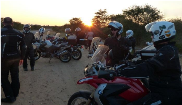
23 Evening MC in Sunset

vejen tager vi et stop i "Sun City", som ligger tre timers kørsel udenfor Johannesburg og tæt på Pilansberg Nationalpark i Sydafrika. Vi besøger nationalparken, som er meget stor – hele 500 km 2 . Her er det muligt at spotte alle "the big five".