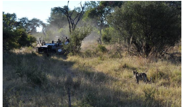
18 Botswana Okavango Game drive Vi ser en leopard

Endnu en gang, skal vi af sted. Men denne gang lader vi motorcyklerne stå, da vi lejer to små fly fra Maun til Okovango. Her bor vi på "The Metabe Lodge", et lækkert, 5-stjerners, "all-inclusive", "telthotel" midt ude i bushen. Fra hotellet tager vi på flere "game drives" (safariture i åbne landrovere). Vi er heldige og ser en smuk leopard og mange andre dyr. I solnedgangen bliver vi serveret drinks, som vi nyder i vore safaristole, mens vi taler om alle de gode oplevelser vi har haft indtil videre, på turen. Imens ser vi flokke af elefanter på op til 100 stykker.