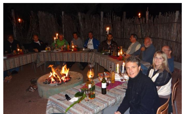
03 Syd Afrika Kwathabisile Lodge Boma

Derefter kører vi videre til "The Kwathabisile Game Lodge" hvor vi spiser middag i den traditionelle "boma". Her sidder vi i kreds omkring bålet, mens kokken disker op med oksekød, antilope, kudo og perlehøns. Der synges og der nydes selvfølgelig en god sydafrikansk rødvin.