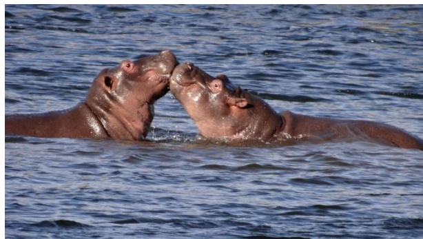
11 Zambia Livingstone Zambezi River Hippo love

Vi vinker farvel til den lille høvding og kører videre. Senere, ankommer vi til vores flotte, 5-stjernede hotel "The Royal Livingstone" i Zambia. Ja, kontrasterne er store i denne del af verden ... Hotellet har en fantastisk udsigt vi skuer hvirvlerne mod Victoria faldet over Zambezi floden, hvor dovne flodheste daser i vandet i den varme eftermiddagssol.