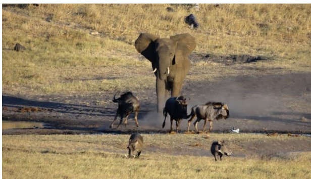
06 Zimbabwe Hwange Elefanten vil drikke

Vi når dagens destination: "The Zimbabwe Hwange Safari-lodge hotel". Et yderst charmerende, dog lidt nedslidt 5-stjernet hotel. Fra mit værelse kan jeg se vandhullet. I solnedgangen dukker der mange dyr op, hvilket er et vidunderligt skue. Jeg ser blandt andet en tørstig elefant jage gnuer og vildsvin på flugt, så den kan drikke i fred. Næste morgen er vi desuden på en spændende safaritur og jeg ser bl.a. to prægtige løver på parringstur.