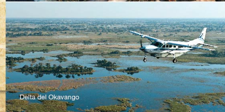
Delta del Okavango

* Horario diario de salida: 8:30 AM / * Horario de almuerzo sugerido en ruta: 12:00-13:00 pm