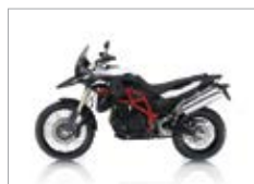
F 700 GS

Base single € 4470 + alquiler de motocicleta *