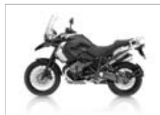
R 1200 GS