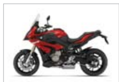
S 1000 XR