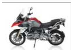
R 1200 GS