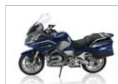
R 1200 RT