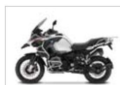
R 1200 GS LC ADVENTURE