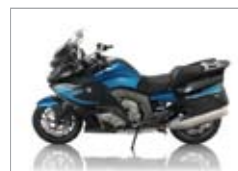
K 1600 GT/GTL