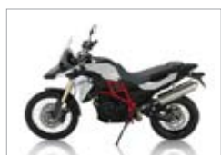
F 800 GS