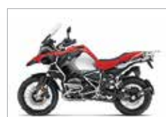
R 1200 GS LC ADVENTURE