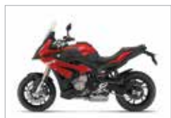
S 1000 XR