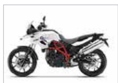
F 800 / 700 GS