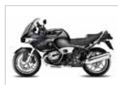
R 1200 RT