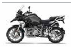
R 1200 GS LC