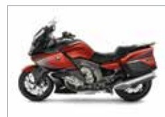
K 1600 GT/GTL